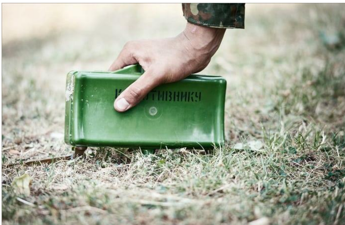
Мина в боевом положении