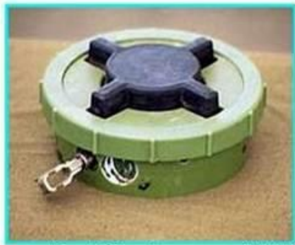
Рис.1 Общий вид мины ПМН-2

ПМН-2 Противопехотная мина нажимного типа